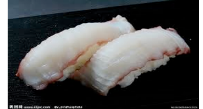
Tako (poulpe) CHE8.00