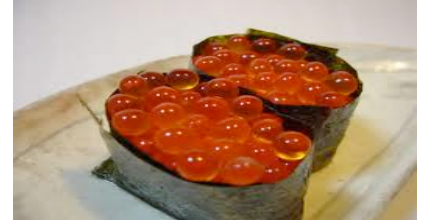
Ikura(œuf de saumon) 10.50