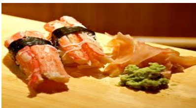
Kani (chair de crabe) CHF11.00