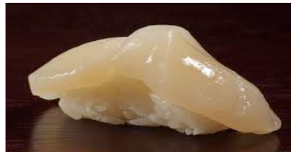
Hotategai(noix de st-jacque)CHF12.00