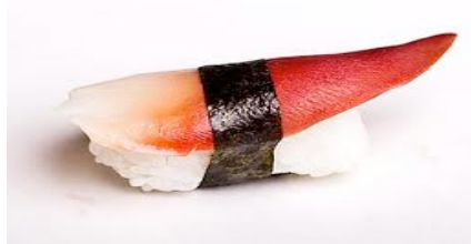
Hokigai(palour de ronde)CHF9.50