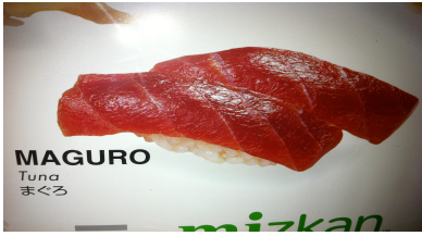
Maguro (thon) CHF 8.50