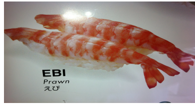
Ebi (crevette cuite) CHF 8.50