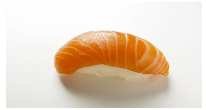
Shake (saumon) CHF 8.50