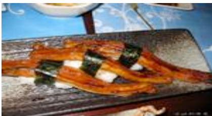
Unagi (anguille grillé) CHF14.00