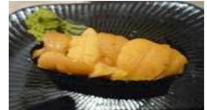
Uni (oursin) CHF 13.00