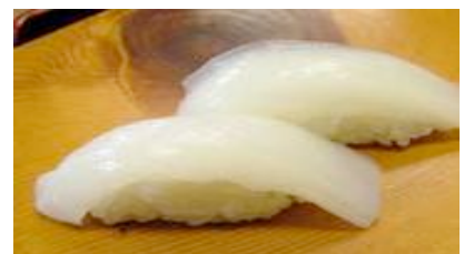
Ika (calamar) CHF 8.00